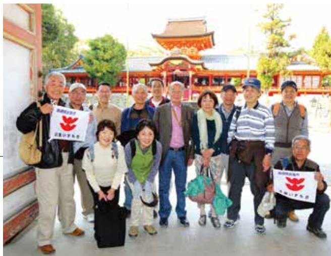
石清水八幡宮にて